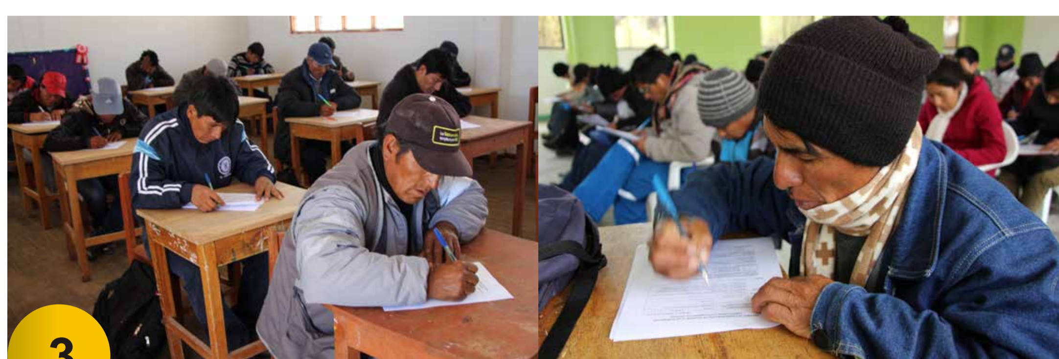
3 Evaluación Escrita