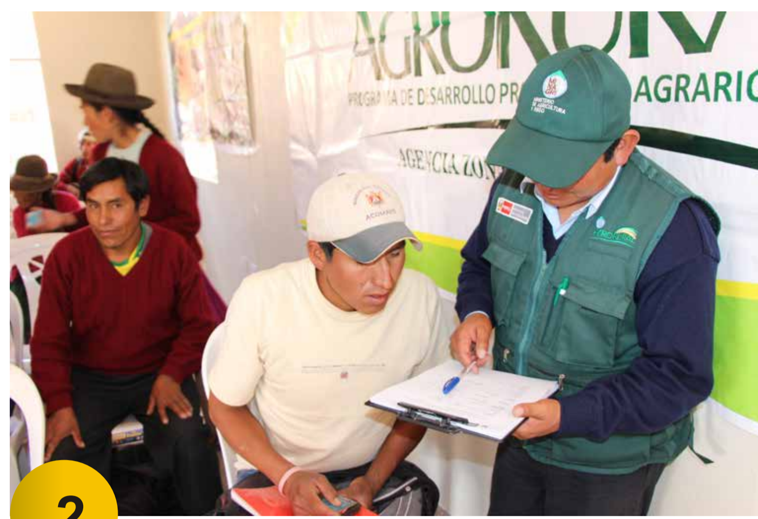
2 Inscripción de Postulantes