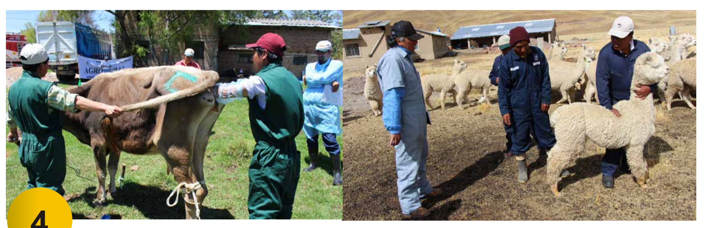
4 Evaluación Práctica