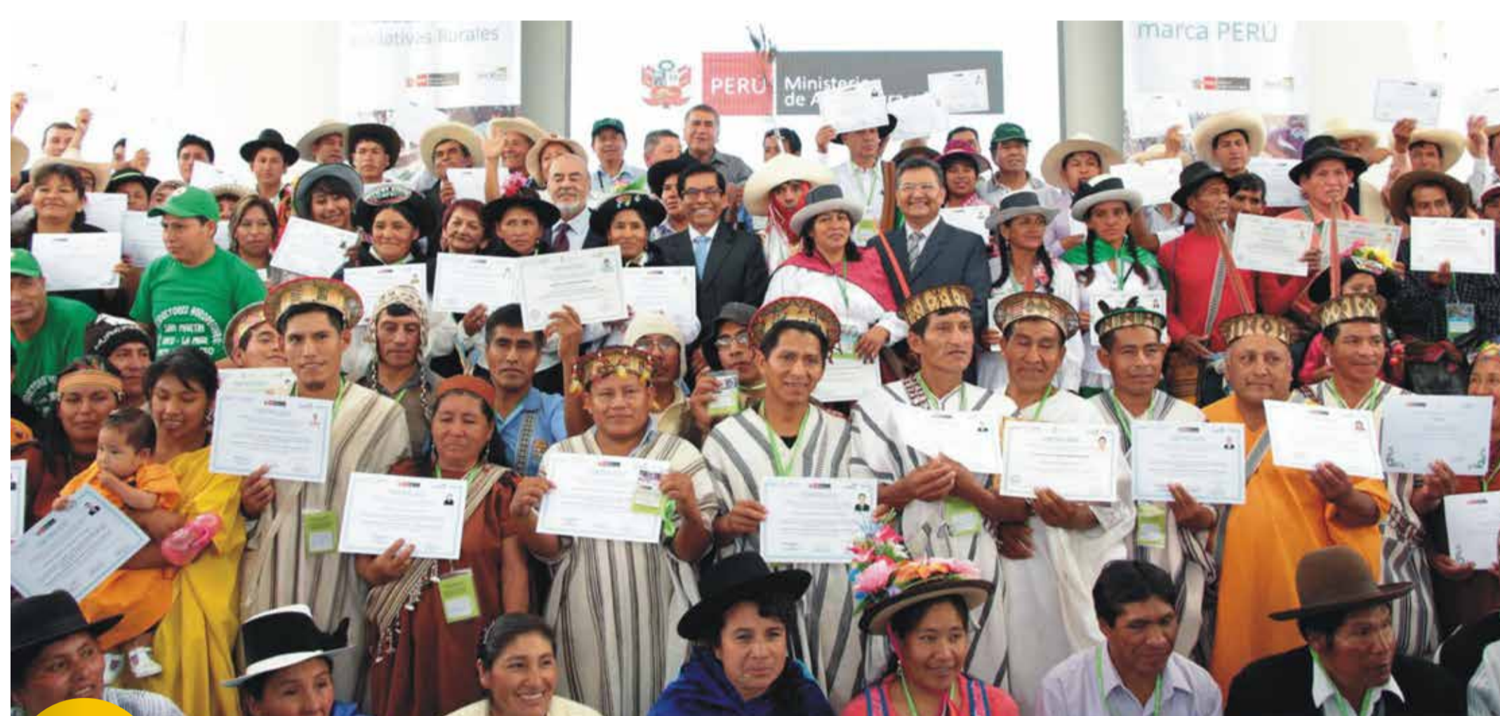
5 Certificación de competencias productivas rurales