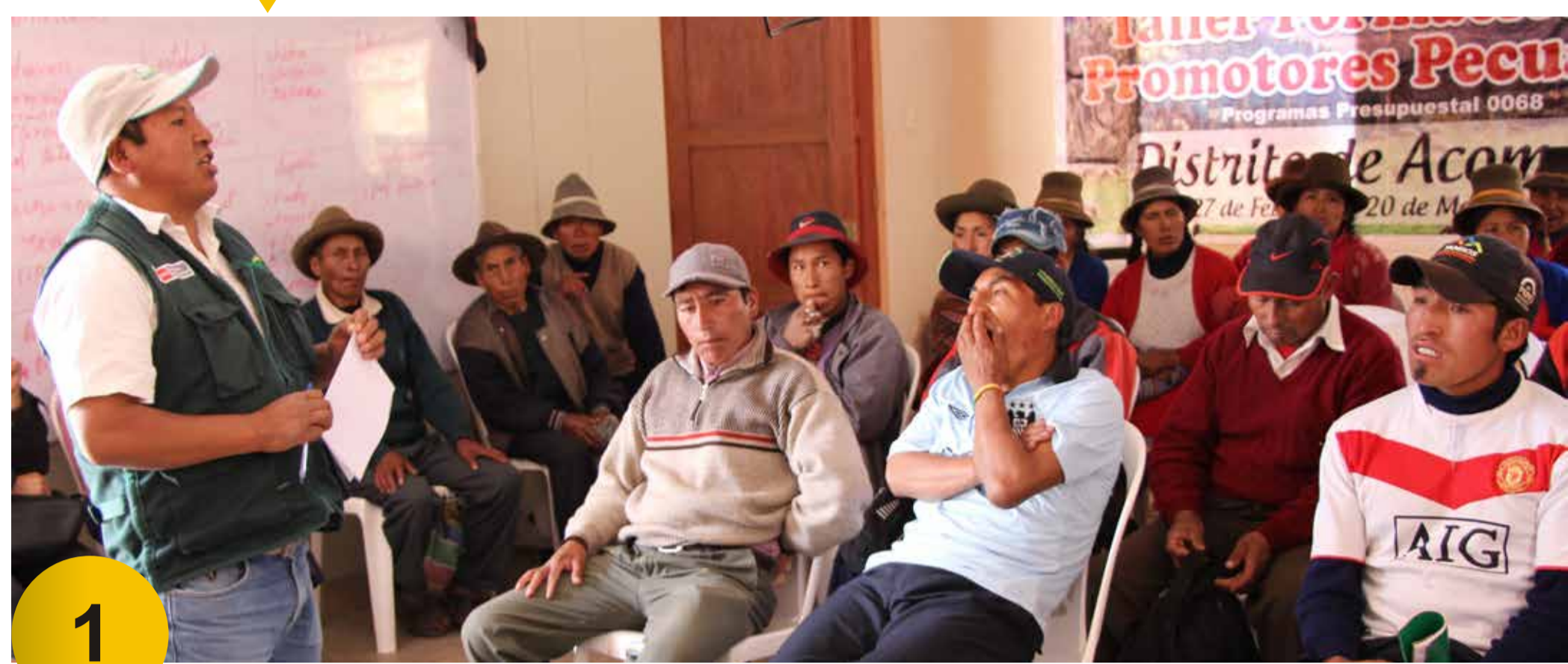
1 Convocatoria y Difusión